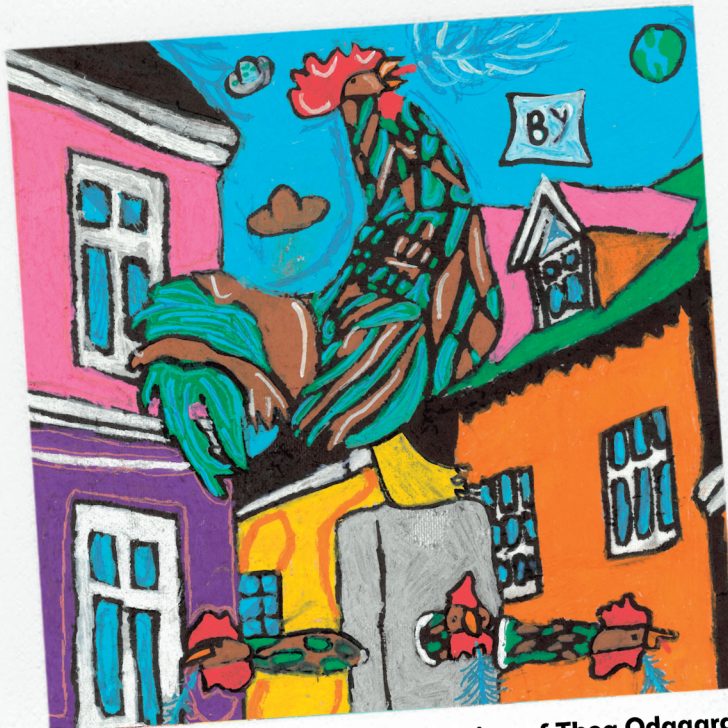
Tegning af Thea Odgaard 4.-5. klasse, Thisted Friskole